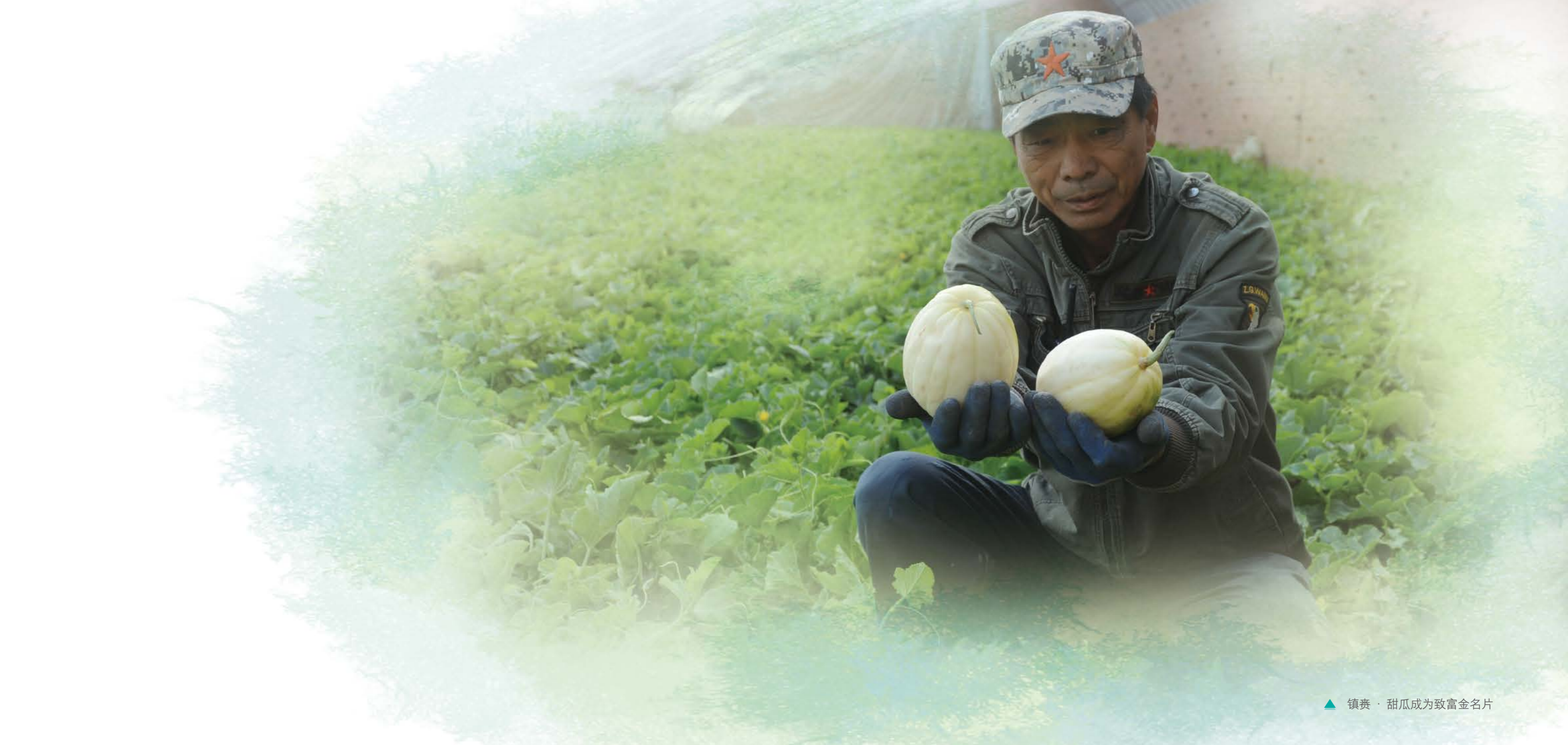
▲ 镇赉 · 甜瓜成为致富金名片