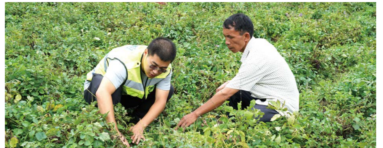
中国一汽在广西凤山县文里村建立高山蔬菜基地、中草药种植及实验基地