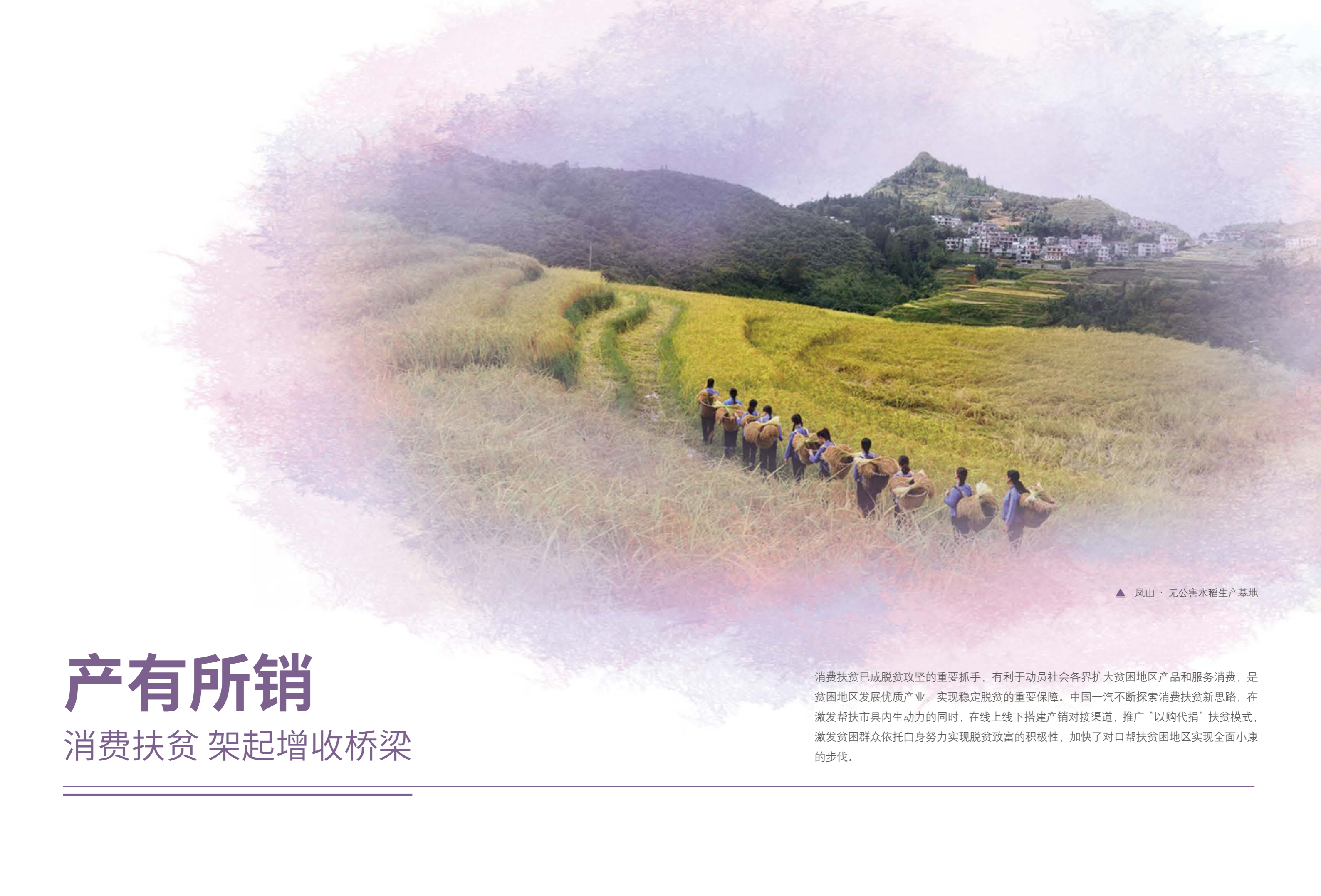
▲ 凤山 · 无公害水稻生产基地