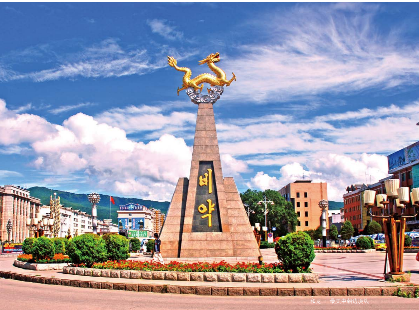
和龙 · 最美中朝边境线