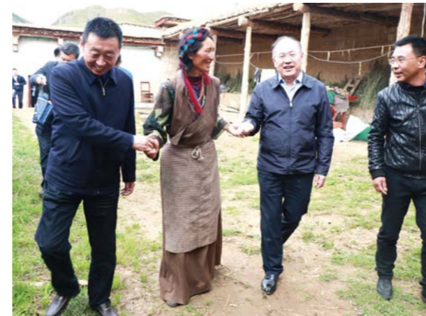
▲ 中国一汽总经理、党委副书记奚国华（右二）赴西藏昌都市左贡县、芒康县等地开展脱贫攻坚实地调研