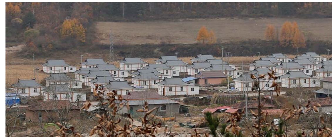
建设后的柳洞村“一汽小镇”

如今，沿着蜿蜒的山路，远远就能看到一栋栋规划整齐的新房坐落于绿荫怀抱里，颇具民居文化气息。这里有金达莱一汽小镇主题公园、朝鲜族特色民宿、房车营地等基础设施，还形成了以餐饮、娱乐、休闲度假、会议为一体的经营模式，人居环境和产业发展都有了很大的改变，这就是和龙市南坪镇柳洞村“一汽小镇”。