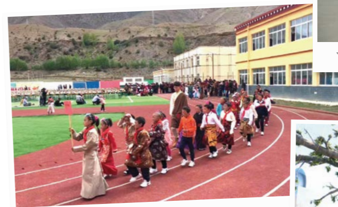
中国一汽援建的藏区田妥希望小学