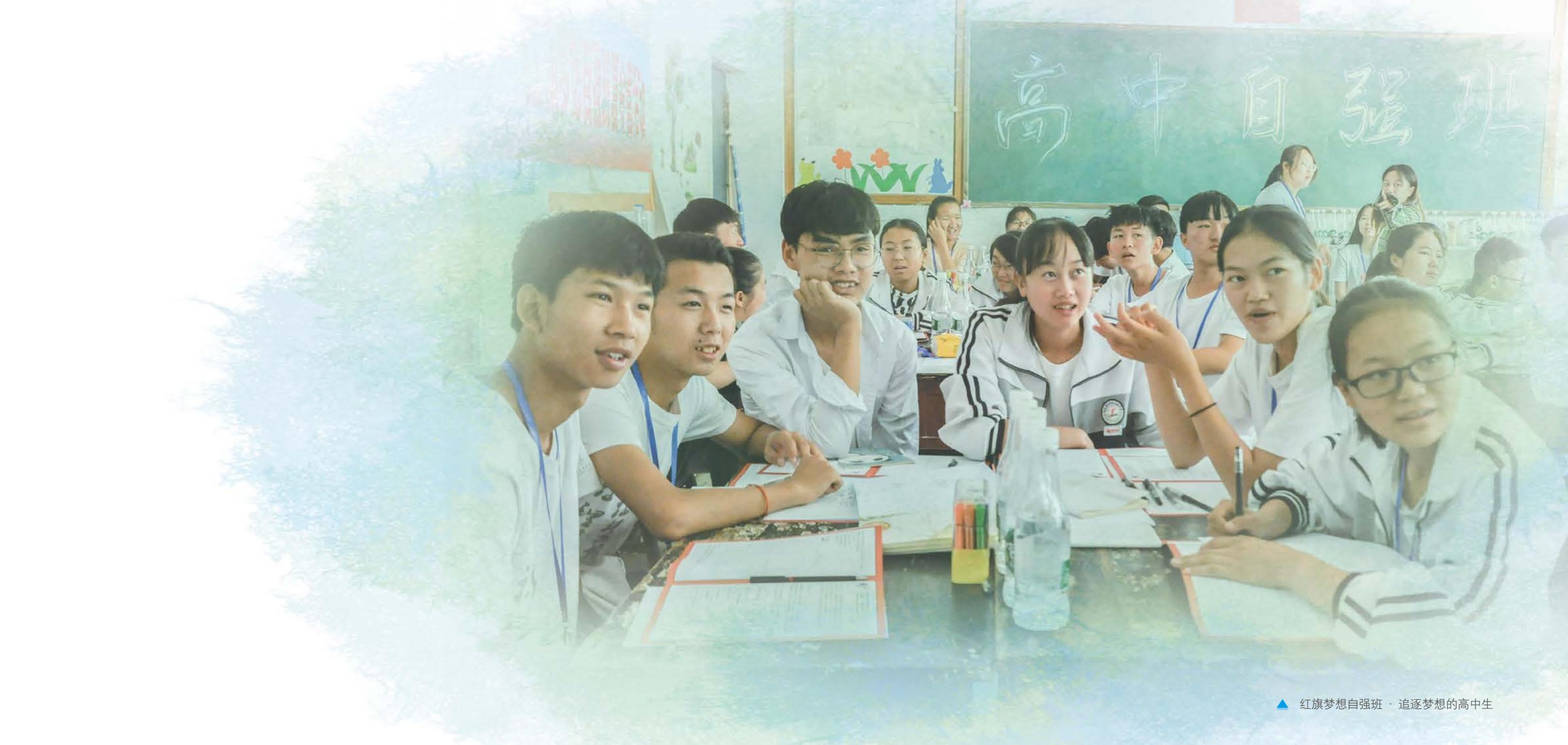
▲ 红旗梦想自强班 · 追逐梦想的高中生