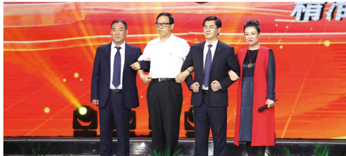
中国一汽和中华少年儿童慈善救助基金会“手挽手”

2019 年，中国一汽积极参与央视《手挽手——精准扶贫央企在行动》大型扶贫专题电视节目，与中华少年儿童慈善救助基金会“吉心工程”成功“手挽手”，在实施贫困人口心脏病救助方面得到了“吉心工程”专业医疗技术、救治基础的支持，并联合开展“红旗 - 99 心”项目，汇聚了健康扶贫合力，更好地解决了健康扶贫项目遇到的实际问题。该项目旨在为中国一汽定点扶贫地区吉林镇赉县、和龙市建档立卡贫困家庭中的心脏病患者筹集医疗资金，免费实施心脏病救助，帮助贫困家庭摆脱“因病致贫”或“因病返贫”的危机。截至目前，项目已帮助 36 名贫困心脏病患者重获健康。