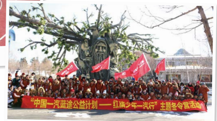
“中国一汽蓝途公益计划——红旗少年一汽行”主题冬令营活动