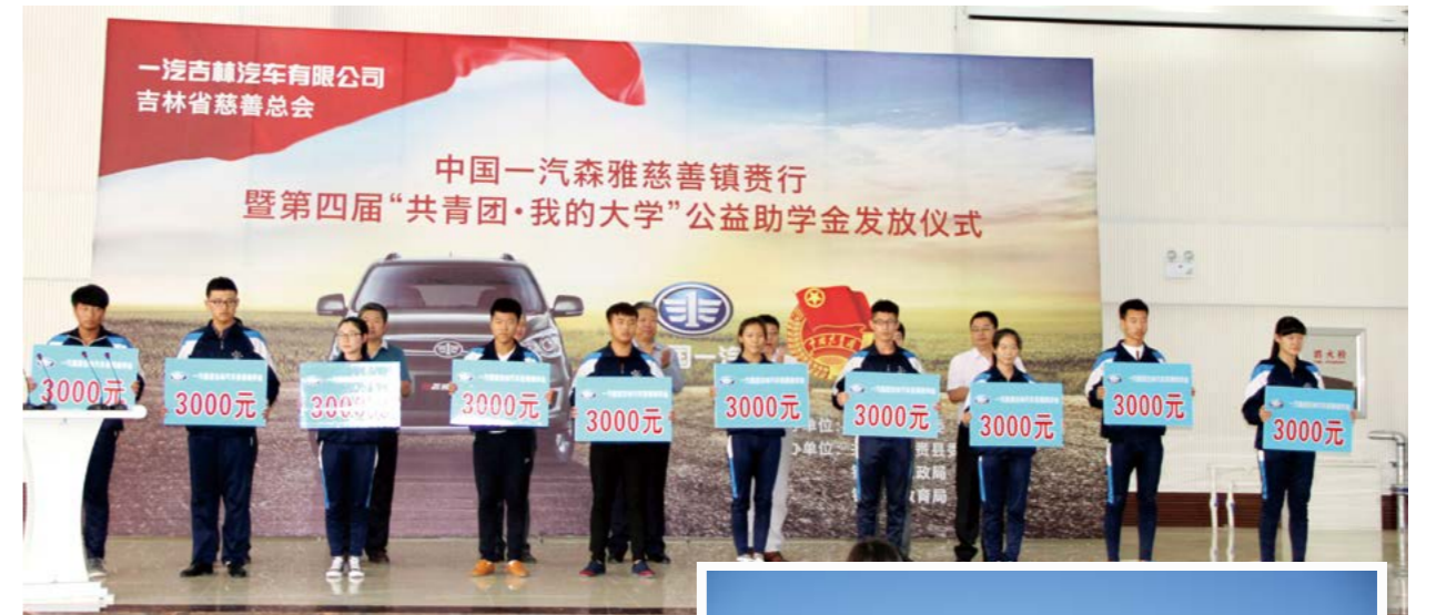
“共青团·我的大学”奖学金授予仪式

此外，中国一汽还在吉林镇赉县、西藏左贡县、广西凤山县等对口帮扶地区开展“共青团·我的大学”“一汽希望小学”“中国一汽蓝途公益计划”等形式多样的教育扶贫活动，帮助更多贫困山村的孩子走出大山、开阔视野，增长知识、提升能力，最终真正摆脱贫困。