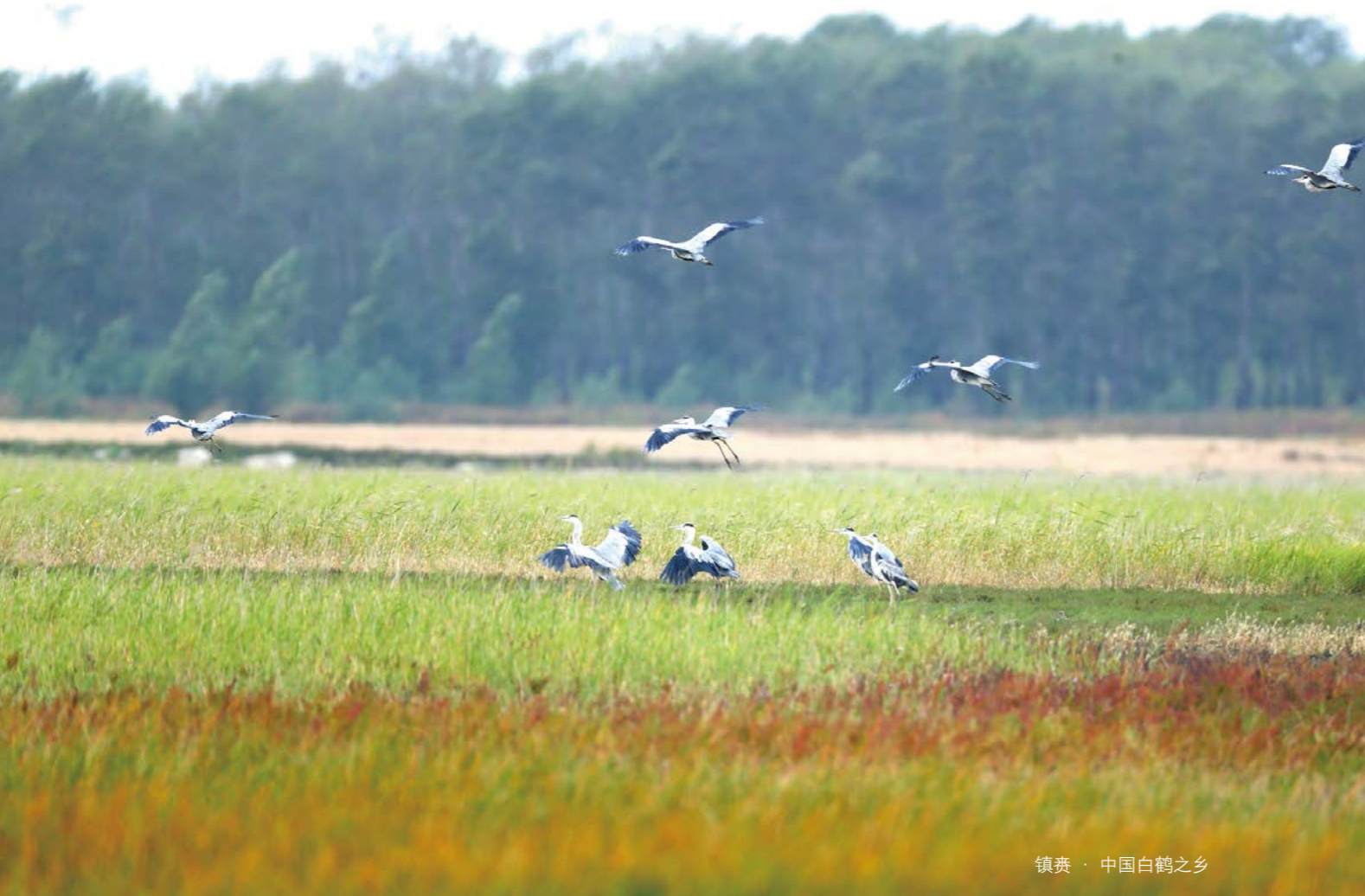
镇赉·中国白鹤之乡