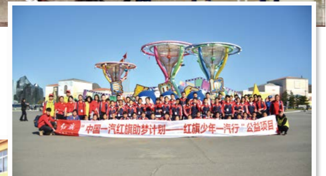
“中国一汽红旗助梦计划——红旗少年一汽行”公益项目