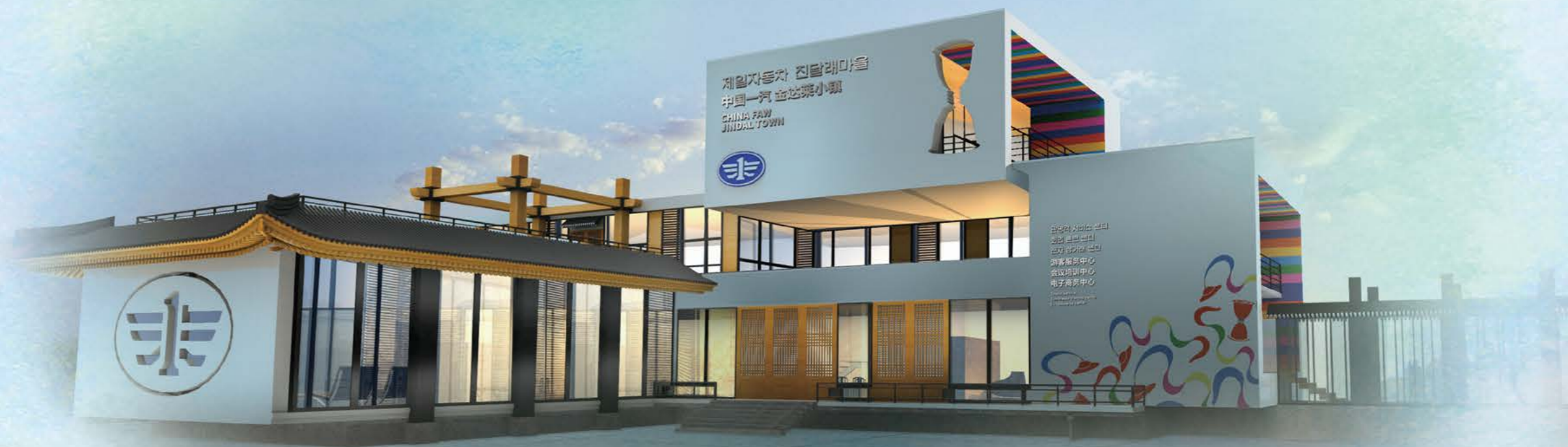
▲ 和龙·“一汽小镇”效果图