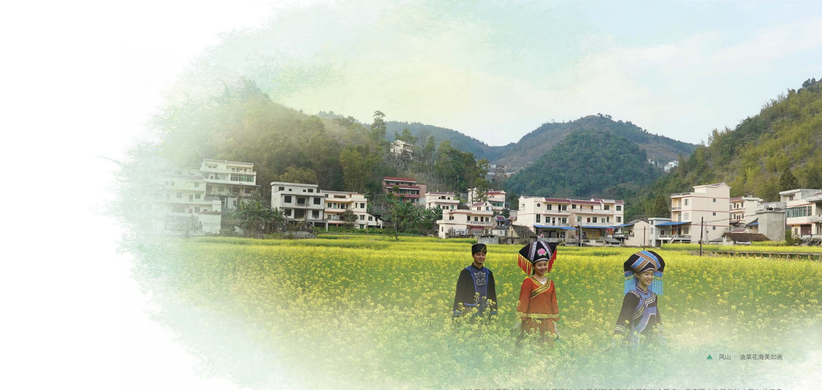
▲ 凤山 · 油菜花海美如画