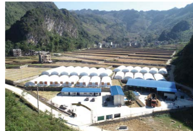
中国一汽在广西凤山县久隆村打造100亩食用菌产业示范基地