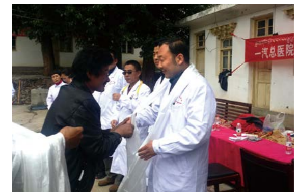
藏区群众为一汽总医院援藏医疗队献哈达

此外，自 2002 年起，中国一汽先后派出 7 批 17 名援藏干部，到昌都市、左贡县、芒康县开展对口援藏工作。多年来，中国一汽累计投入 1.8 亿元，在基础设施建设、特色产业发展、医疗卫生、教育事业等领域开展了 90 余个帮扶项目，有效改善了当地群众的生产生活条件，促进了帮扶地区经济社会的发展。2018 年，中国一汽投入援藏资金 2,610 万元，继续推动“三区三州”深度贫困地区的脱贫攻坚步伐，同年派出的 3 名援藏干部被评为“昌都市县级优秀公务员”。