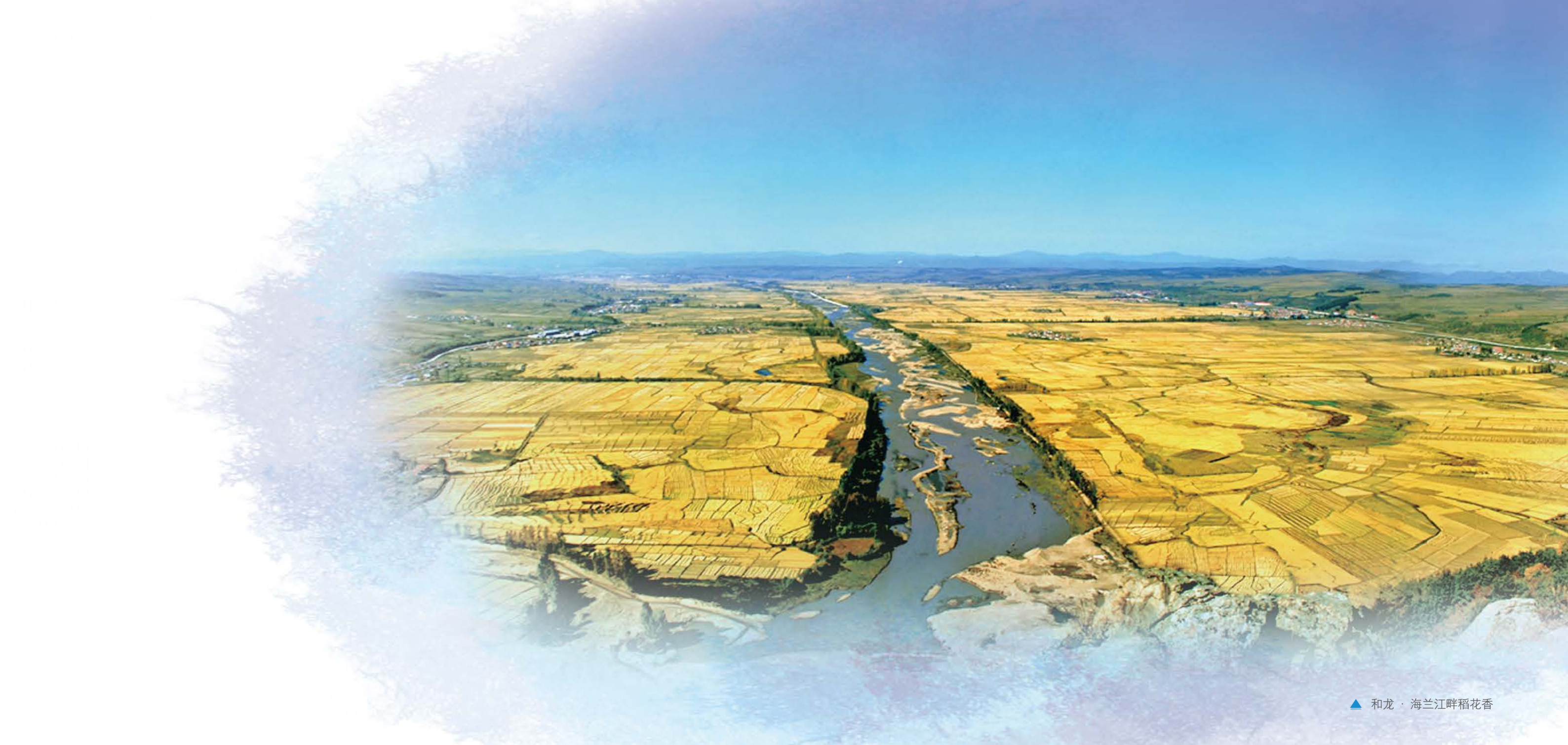
▲ 和龙·海兰江畔稻花香