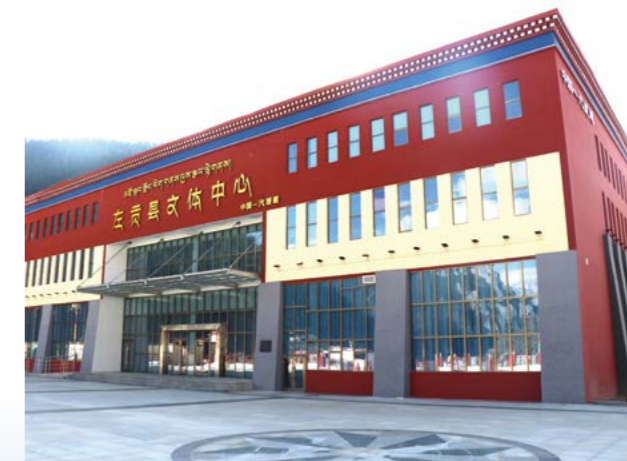
中国一汽援建的昌都市左贡县综合文体中心

左贡县位于西藏东南部，是历代商贾由茶马古道进出西藏的必经之地。入藏伊始，中国一汽将当地藏民交通问题纳为首要解决问题，为左贡县捐赠100万元的汽车，极大地缓解当地藏民出行难的困局。在援藏工作中，中国一汽注重改善农牧区基础设施建设，推进“菜篮子”工程，为当地群众建设农贸市场，方便群众基本生活需求，该工程目前已惠及大部分当地百姓。此外，在2015至2017年，中国一汽先后投入资金2,310万元，在左贡县建设集体育赛事、知识宣讲、电影院及会展功能于一体的综合文体中心。