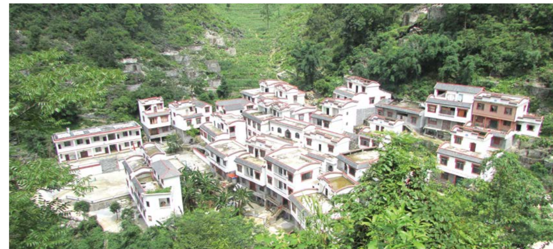
中国一汽帮扶建设后的瑶寨屯新貌

该县央峒村瑶寨屯是中国一汽在当地建设的第一个“一汽小镇”。针对该屯收入来源少、住房条件差、缺文体设施、教学点设备简陋等困难，中国一汽派出多名党委班子成员，先后分别带队赴当地开展扶贫实地调研，并在此开展“百县万村”活动，集中解决当地缺水、缺电、缺路的问题，建设“一汽小镇”，实施供水工程、道路硬化、学校翻新等 19 个子项目，切实改善了瑶寨屯的居住环境和生活条件。如今，家乡发展好了，年轻人自然也愿意留下，可为当地带来人才资源，激发内生动力，实现真脱贫。现在，瑶寨屯已经成为中国一汽定点扶贫的典范。