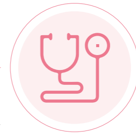
中国一汽医疗援藏措施

积极开展义诊送药活动，数次深入到左贡县和芒康县的乡镇及希望小学开展眼病筛查项目，并为帮扶地区的贫困患者免费实施白内障手术