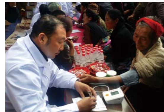
一汽总医院援藏医疗队在藏区开展义诊救助活动