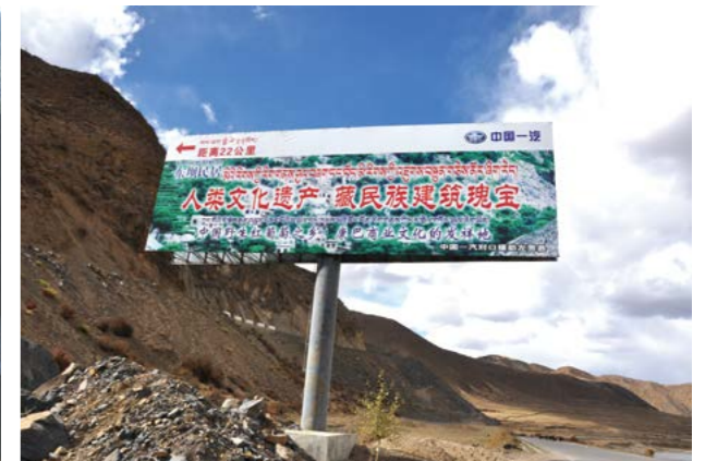
西藏左贡县野生红葡萄基地指示牌