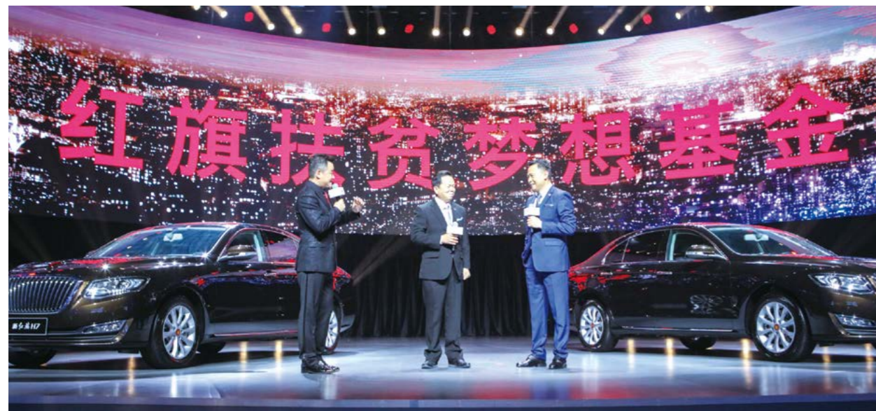
中国一汽董事长、党委书记徐留平在“红旗扶贫梦想基金”成立仪式上发言