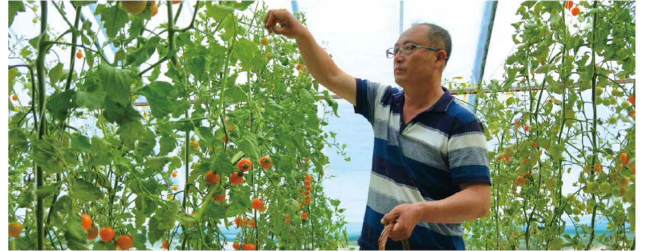
中国一汽投入专项资金在吉林镇赉县建设标准日光温室大棚

精准扶贫、精准脱贫都离不开产业的支撑。在吉林镇赉县、广西凤山县、西藏左贡县、西藏芒康县等中国一汽的其他定点扶贫乡村，相同的故事也在不断上演，当地贫困村民的脱贫致富梦正一步步走进现实。